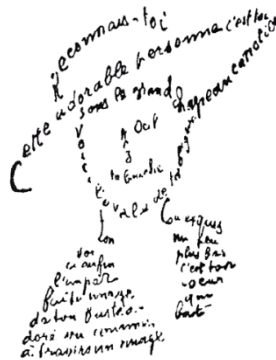
Calligramme de Guillaume Apollinaire

L'objectif de ce cours est de présenter aux étudiants les différentes composantes du domaine cinématographique. Les activités de ce cours permettent, dans un premier temps, de démystifier les différents métiers du cinéma (réalisateur, producteur, scénariste, critique de film, conservateur, et bien d'autres) ainsi que les lieux de conservation et de diffusion de la culture cinématographique. Dans un deuxième temps, l'étudiant sera initié aux éléments du langage cinématographique ainsi qu'aux codes spécifiques de la représentation filmique. Le cours a également pour but de mettre l'étudiant en contact avec différentes façons d'utiliser ces composantes pour raconter des histoires. Ainsi, il réalisera que le cinéma est un instrument de communication et un moyen d'expression personnelle.