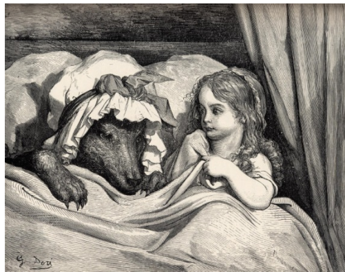
Le Petit Chaperon rouge par Gustave Doré

La chanson accompagne notre quotidien et marque les générations. Le genre possède son propre langage, que nous aborderons à travers un panorama de la chanson francophone à partir de ses grands auteurs et interprètes. Nous y dégagerons ses principaux thèmes en lien avec les contextes sociaux qui les ont vus naître.